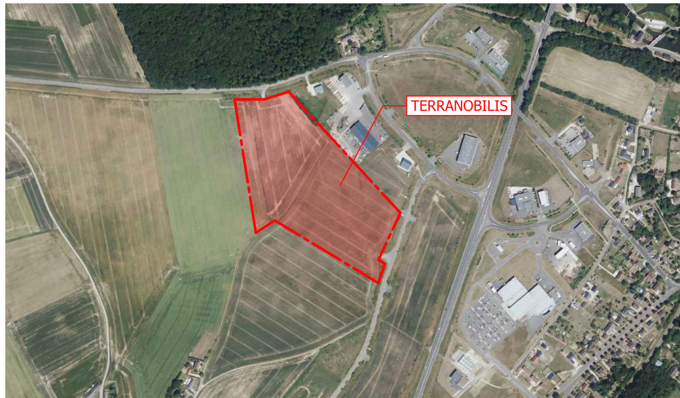
SITUATION - 1/5000 e